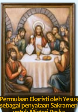
Permulaan Ekaristi oleh Yesus sebagai pernyataan Sakramen untuk Misteri Paska

Sedang Yesus berdoa, wajah-Nya berubah dan pakaian-Nya menjadi putih berkilauan. (Luk 9:35)