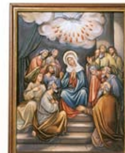
Roh Kudus turun keatas para Rasul

Setelah Yesus berkata demikian, Dia terangkat ke Syurga, sementara mereka memandang Dia. Lalu awan menutupi Dia daripada pandangan mereka.... “Hai orang Galilee, mengapa kamu berdiri menengadahkan ke langit? Yesus, yang kamu lihat terangkat ke Syurga, akan kembali lagi dengan cara yang sama seperti yang kamu lihat tadi.” (Kis 1:9;11)