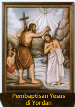
Pembaptisan Yesus di Yordan

Pada masa itu Yesus meninggalkan Galilea lalu pergi ke Sungai Yordan. Di situ Dia menemui Yohanes dan minta supaya dibaptis olehnya. (Mat 3:13)