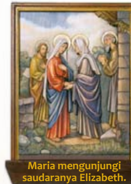
Maria mengunjungi saudaranya Elizabeth.

“Janganlah takut Maria, kerana Allah berkenan kepada engkau. Engkau akan mengandung, lalu melahirkan seorang anak lelaki. Hendaklah engkau menamakan Dia Yesus.” (Luk 1:30-31)