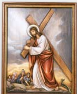
Yesus memikul Salib-Nya ke gunung Kalvari

Mereka memakaikan jubah ungu pada Yesus, serta membuat mahkota daripada ranting-ranting berduri lalu meletakkannya pada kepala Yesus. Setelah itu mereka memberi hormat kepada-Nya, “Daulat raja orang Yahudi!” (Mrk 15:17-18)