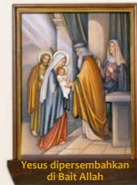
Yesus dipersembahkan di Bait Allah

“Dia melahirkan seorang anak lelaki, anaknya yang sulung. Anak itu dibedungnya lalu diletakkan di dalam palung kerana mereka tidak mendapat tempat untuk menumpang.” (Luk 2:7)