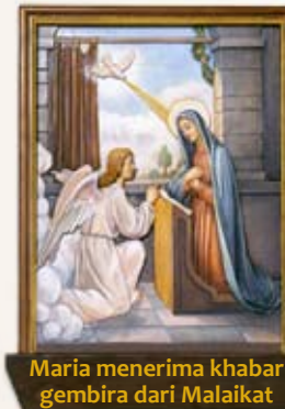
Maria menerima khabar gembira dari Malaikat

“Janganlah takut Maria, kerana Allah berkenan kepada engkau. Engkau akan mengandung, lalu melahirkan seorang anak lelaki. Hendaklah engkau menamakan Dia Yesus.” (Luk 1:30-31)