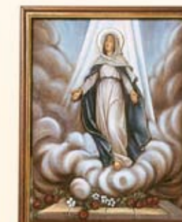
Maria diangkat ke Syurga

Tiba-tiba terdengar dari langit seperti tiupan angin yang kuat. Bunyi itu memenuhi rumah tempat mereka sedang duduk... Mereka semua dikuasai oleh Roh Allah. Mereka mula berkata-kata dalam pelbagai bahasa lain, menurut apa yang diberi oleh Roh Allah kepada mereka. (Kis 2:2,4)