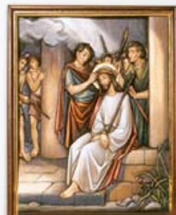
Yesus dimahkotai duri

“Pilatus hendak menyenangkan hati orang ramai, maka dia membebaskan Barabas untuk mereka. Kemudian dia menyuruh orang mencambuk Yesus dan menyerahkan Dia kepada askar supaya disalib.” (Mrk 15:15)