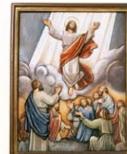
Yesus naik ke Syurga

“Jangan takut! Aku tahu bahwa kamu mencari Yesus yang telah disalibkan itu. Dia tidak ada di sini. Dia sudah bangkit seperti yang dikatakan-Nya dahulu”. (Mat 28:5-6)