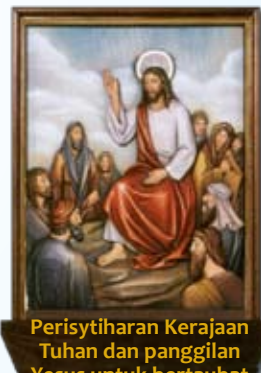
Perisytiharan Kerajaan Tuhan dan panggilan Yesus untuk bertaubat

Lalu Yesus berkata kepada mereka, “sekarang ambillah sedikit air itu dan hidangkannya kepada ketua majlis.” Ketua majlis itu mengecap air yang sudah berubah menjadi wain. (Yoh 2:8,9)