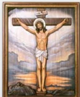
Yesus Wafat di salib

Sambil memikul salib-Nya, Yesus pergi ke luar Bandar ketempat yang bernama “Tempat Tengkorak” (Dalam bahas albrani tempat itu disebut “Golgota”) (Yoh 19:17)