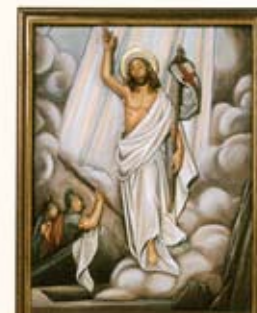
Yesus bangkit dengan mulia.

“Jangan takut! Aku tahu bahwa kamu mencari Yesus yang telah disalibkan itu. Dia tidak ada di sini. Dia sudah bangkit seperti yang dikatakan-Nya dahulu”. (Mat 28:5-6)