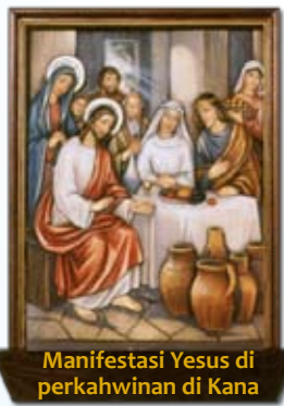
Manifestasi Yesus di perkahwinan di Kana

Pada masa itu Yesus meninggalkan Galilea lalu pergi ke Sungai Yordan. Di situ Dia menemui Yohanes dan minta supaya dibaptis olehnya. (Mat 3:13)