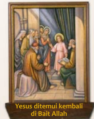
Yesus ditemui kembali di Bait Allah

“Anak ini sudah dipilih oleh Allah untuk membinasakan dan menyelamatkan banyak orang Isreal. Dia akan menjadi tanda daripada Allah, yang akan dilawan oleh banyak orang, dan dengan demikian terdedahlah rahsia fikiran mereka. Seperti pedang tajam, kesedihan akan menikam hatimu”. (Luk 2:34-35)