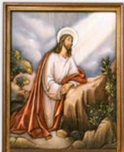
Yesus berdoa kepada Bapa-Nya di Syurga dalam Sakrat Maut

Dia berdoa, “Bapa, ya Bapa-Ku! Tidak ada satu perkara yang mustahil bagi bapa. Jauhkanlah cawan penderitaan ini daripada-Ku. Tetapi janganlah turut kehendak-Ku, melainkan kehendak Bapa sahaja.” (Mrk 14:36)